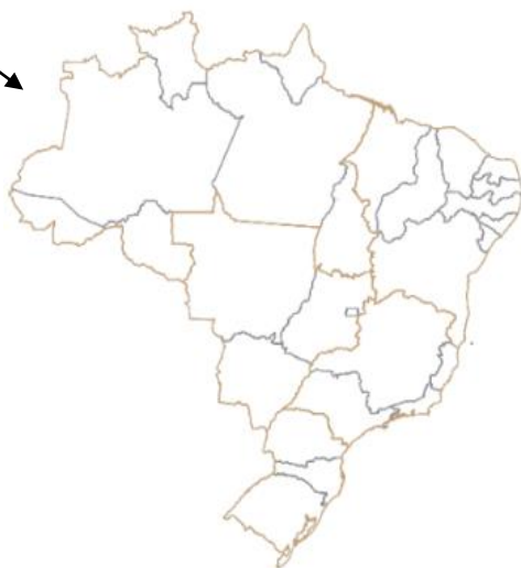
Mapa 1 – Brasil, Grandes Regiões e Unidades da Federação

Para disponibilizar uma ilustração, estas devem ser precedidas de sua palavra designativa (desenho, esquema, fluxograma, fotografia, gráfico, mapa, organograma, planta, quadro, retrato, figura, imagem, entre outros), seguida de seu número de ordem de ocorrência no texto, em algarismos arábicos, de travessão e do respectivo título. Imediatamente após a ilustração, deve-se indicar a fonte consultada (mesmo sendo o próprio autor) conforme a ABNT NBR 10520, legenda, notas e outras informações necessárias à sua compreensão (se houver). Esta deve ser citada no texto e inserida o mais próximo possível do trecho a que se refere. Tipo, número de ordem, título, fonte, legenda e notas devem acompanhar as margens da ilustração.