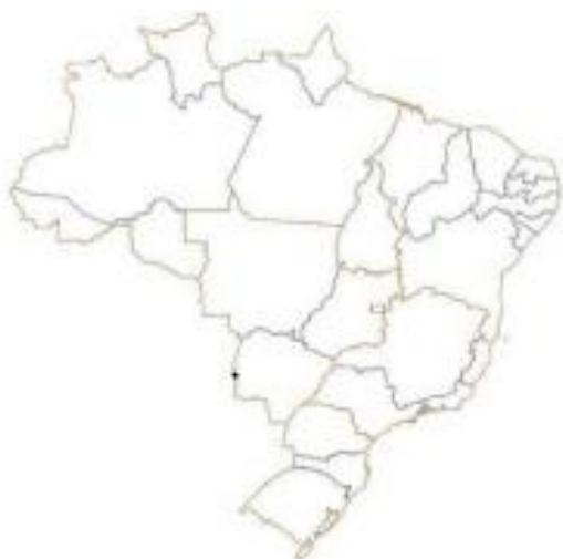
Mapa 1 – Brasil, Grandes Regiões e Unidades da Federação

Abaixo modelo para disponibilizar uma ilustração, estas devem ser precedidas de sua palavra designativa (desenho, esquema, fluxograma, fotografia, gráfico, mapa, organograma, planta, quadro, retrato, figura, imagem, entre outros), seguida de seu número de ordem de ocorrência no texto, em algarismos arábicos, de travessão e do respectivo título. Imediatamente após a ilustração, deve-se indicar a fonte consultada (mesmo sendo o próprio autor) conforme a ABNT NBR 10520, legenda, notas e outras informações necessárias à sua compreensão (se houver). Esta deve ser citada no texto e inserida o mais próximo possível do trecho a que se refere. Tipo, número de ordem, título, fonte, legenda e notas devem acompanhar as margens da ilustração.